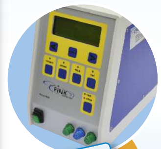
optional: Ausführung in IP65-Gehäuse