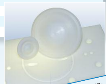
PTFE-Pumpenkammer mit Membran

** max. Viskosität unter Verwendung der Software R05-AK